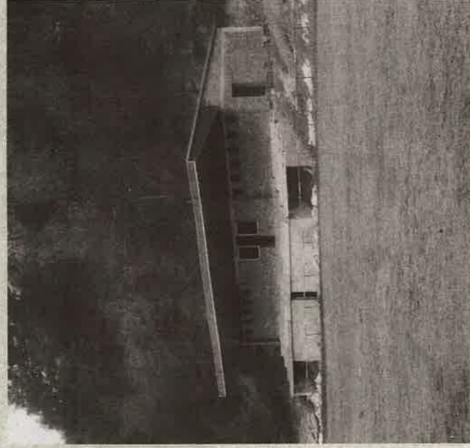
VÝSTAVBA TRIBÚNY NA IHRISKU ŠK BELÁ POČAS 90. ROKOV MINULÉHO STOROČIA