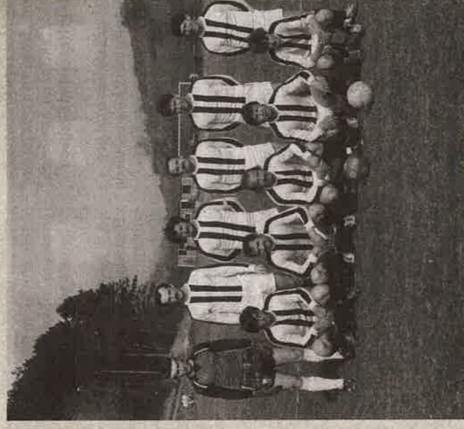
MUŽSTVO I. TRIEDY OKOLO ROKU 1990