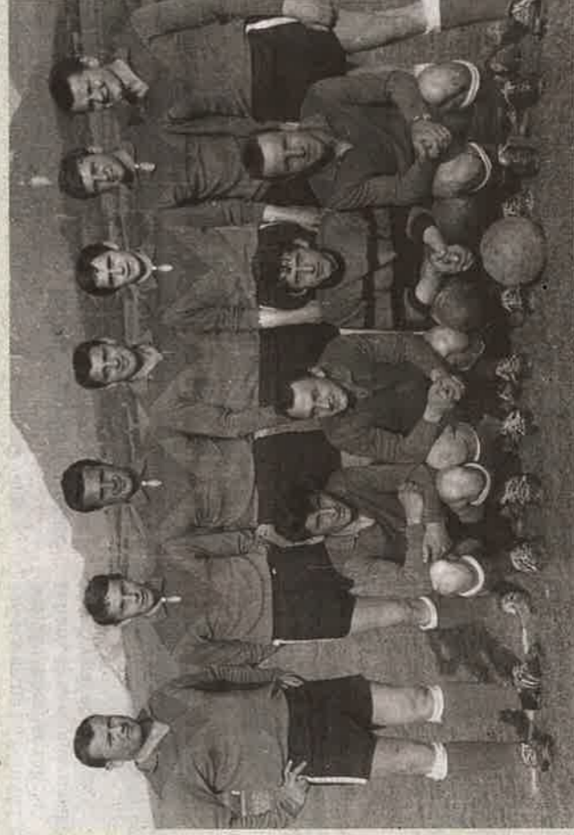
JEDNA Z NAJSTARŠÍCH SNÍMOK FUTBALISTOV ŠK BELÁ